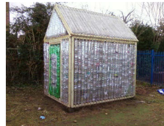
Foinse an Íomhá