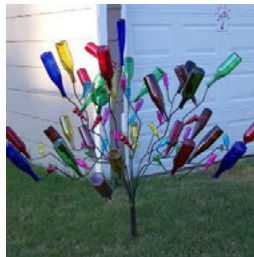
Foinse an Íomhá