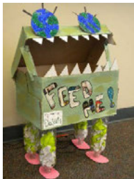
Foinse an Íomhá