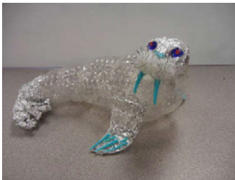
Foinse an Íomhá